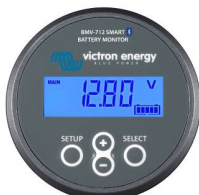
Bluetooth-Sensorik: BMV-712 Smart Batteriewächter