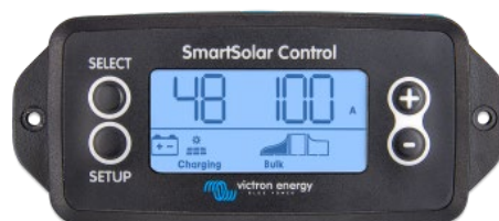
SmartSolar einsteckbares Display