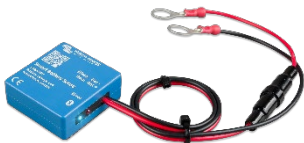
Bluetooth-Sensorik: Smart Battery Sense