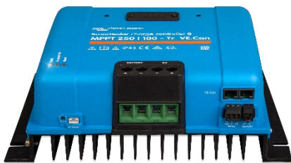
SmartSolar-Lade-Regler MPPT 250/100-Tr VE.Can ohne Display