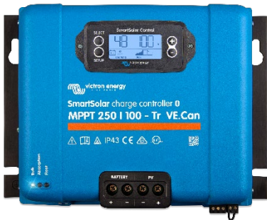
SmartSolar-Lade-Regler MPPT 250/100-Tr VE.Can mit Option einsteckbares Display